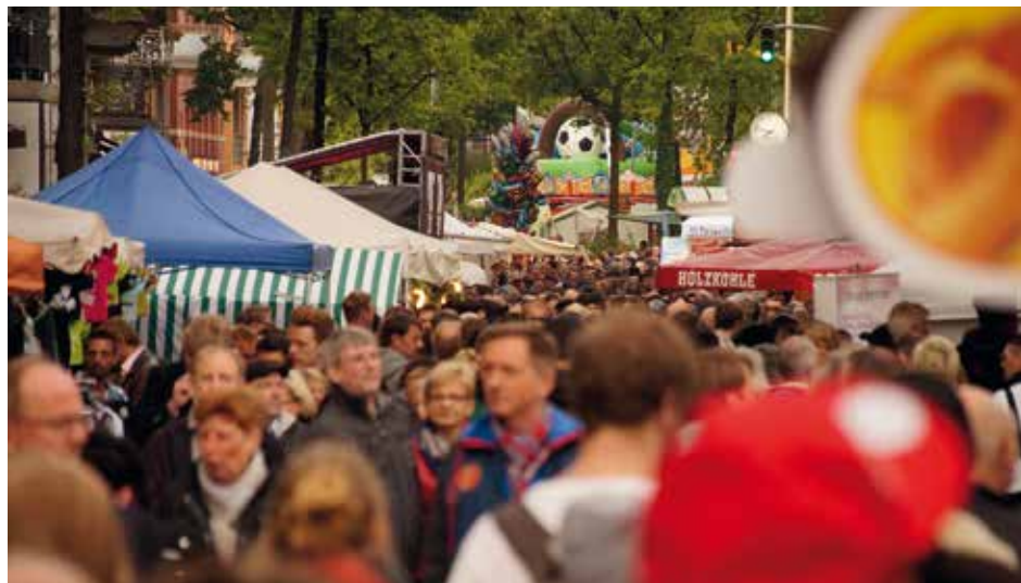
Bei großartigem Wetter war das Stadtfest St. Georg bestens besucht