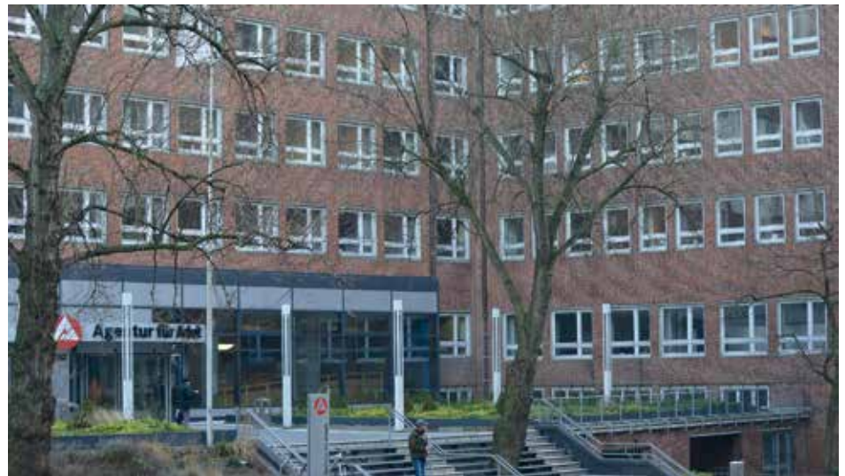
Blick auf die Agentur für Arbeit

Da St. Georg als Stadtteil der Gegensätze bekannt ist und sich gerade die „Lange Reihe“ als sehr multikulturelles Viertel auszeichnet, ist es vielleicht die „große Schwester“ vom Glockenbachviertel in München, Praktikawelten Heimatstadt. „Ich finde St. Georg ist ein Stadtteil, der