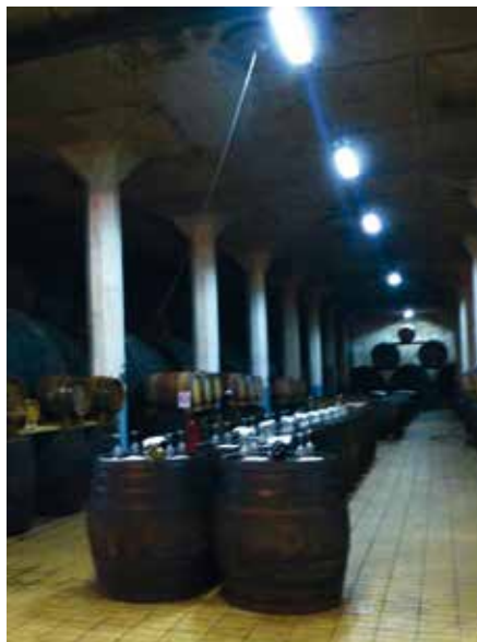
Hier lagert der „Amselfelder“ im Kosovo

Im Südwesten des Landes liegt Kosovos Weinregion, hier wurde schon in der Römerzeit der Wein gekeltert. Die Firma, die den „Amselfelder“ machte, wurde eines der größten Weinkombinate im ehemaligen Jugoslawien, und diesen Erfolg hatte sie einem deutschen Weinimporteur